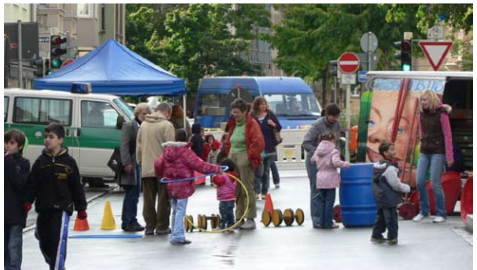
Äktschnbus und Polizei in der Knauerstraße

Sprecherin Stadtteil-Arbeitskreis Gostenhof-Ost