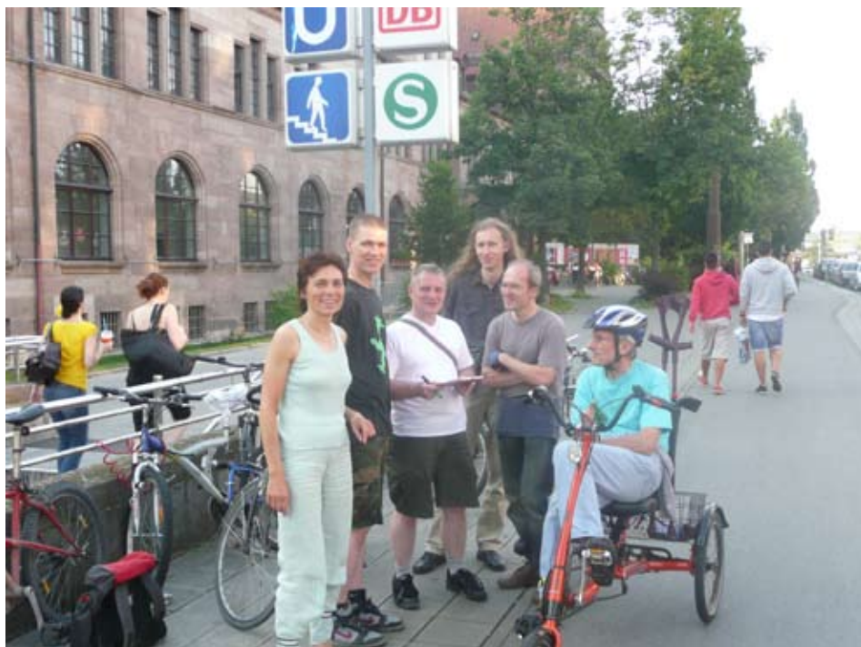
Abstrampeln für ein besseres Radwegennetz: Mitglieder der Projektgruppe Verkehr auf Tour